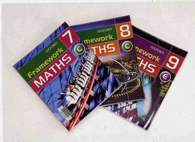
イギリスの教科書

2) 各種図鑑：市民に広く利用されるよう、目で楽しめる図鑑を中心にきめ細かく収集しています。植物図鑑は植物全般のほか、シーボルトの『日本植物誌』や『食用キノコと毒キノコのコリンズガイド』『南西部のサボテン』『洋ランのイラスト付宝典』『バラ科』というように、キノコ類、サボテン類、ラン類、バラ類に分類されます。動物図鑑は動物全般の生態や絶滅危惧種、地域ごとの動物、貝類、昆虫、魚類、は虫類、両生類、鳥類、哺乳類と多種にわたるものです。写真や絵画が多く掲載された美しい本が多く、なかでもアメリカの画家であり、博物学者でもあるジョン・ジェームズ・オーデュボンが描いた大判博物画の複製は、生息環境の中で躍動的に描かれた実物大の鳥類の図鑑で、見る者の目をとらえてやみません。