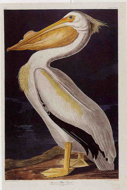
『アメリカの鳥』オーデュボン画