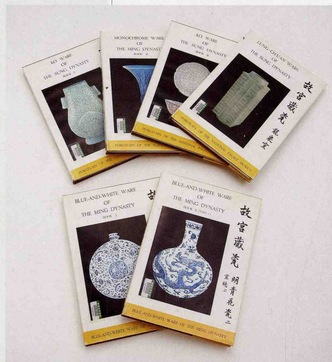
『故宮藏瓷』 国立故宮博物院編

3) 美術書：美術・工芸研究と鑑賞のために、14世紀から20世紀に至る個人作品集を中心に収集しています。工芸書のなかでは陶磁器についての名著が多く、イギリスの陶磁器研究家ホブソンの著作は、『中国陶磁器図録』をはじめほぼそろっています。また、世界の有名美術館所蔵品図録なども充実しています。