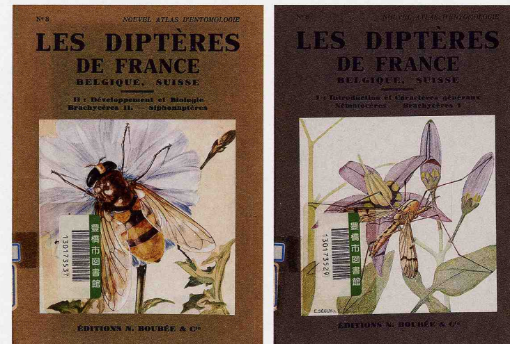
『フランス昆虫図鑑』