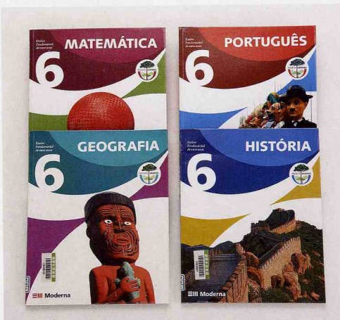
ブラジルの教科書

1) 絵本と教科書：エリック・カール、モーリス・センダックをはじめとした有名な絵本作家の作品などを含め、約9,000冊の世界の絵本を所蔵しています。眺めているだけでも楽しめる多彩な絵本の数々は、言葉の壁を越えて、小さな子どもたちをもつ家族にも人気のコレクションです。また、アメリカを筆頭に世界84の国々から集められた色彩豊かな教科書コレクションは10,000冊を超えています。